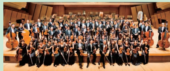
新日本フィルハーモニー交響楽団

ニー交響楽団のホームページをご覧ください。 【対象】 区内在住在勤在学の小学校4年生以上(平成30年4月1日現在)で、ダンスに興味がある方 【定員】 20人(抽選) 【練習日程】 5月5日(祝)~7月20日(金)で10回程度 【費用】 無料 【申込み】 4月30日までに新日本フィルハーモニー交響楽団のホームページから申込み