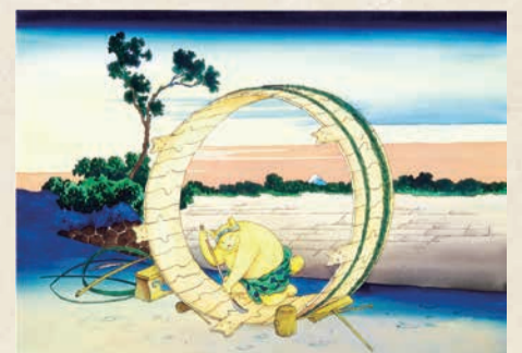
ますむらひろし<尾州不二見原(富嶽三十六景)> 2010年発表 ©ますむら・ひろし

【ところ】すみだ北斎美術館(亀沢2-7-2)【入館料】▶一般=1000円 ▶高校生・大学生・65歳以上の方=700円 ▶中学生・障害のある方=300円 *団体割引あり【申込み】期間中、直接会場へ【問合せ】すみだ北斎美術館 ☎5777-8600(ハローダイヤル)