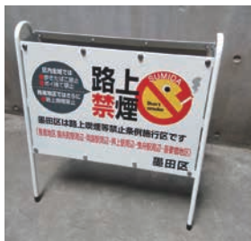
路上喫煙禁止の啓発看板(白色)

【問合せ】 ▶路上喫煙禁止看板について＝地域活動推進課地域活動推進担当 ☎5608-3661 ▶違法駐輪禁止兼路上喫煙禁止看板について＝土木管理課交通安全担当 ☎5608-6203