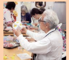
キラキラ茶家での一コマ