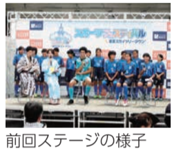
前回ステージの様子

【とき】午前10時～午後5時半【ところ】東京スカイツリータウン®(押上1-1-2)【内容】「ウォーク&ラン」をテーマとしたトークショー、ボクシングや卓球等の体験ブースなど【入場料】無料【申込み】当日直接会場へ