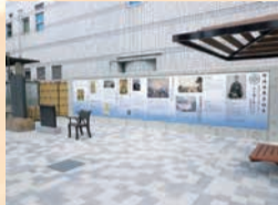
勝海舟生誕の地、両国公園

【内容】勝海舟と西郷隆盛らに縁のある史跡を巡るガイドツアー *一部バスで移動【とき】11月10日(土)・17日(土)午前9時～午後4時(予定)【集合場所】▶11月10日=東京国立博物館前(台東区上野公園13-9) *JR両国駅で解散 ▶11月17日=墨田区役所1階正面玄関前 *浅草寺(台東区浅草2-3-1)付近で解散【定員】各日30人程度(抽選)【費用】各日6000円(昼食代込み)【申込み】希望日・住所・氏名・年齢・性別・電話番号・人数(2人まで)を、はがきまたはファクスで10月19日(必着)までに墨田区観光協会(〒130-0001吾妻橋3-4-5) ☎5608-6951・FAX5608-7130へ *墨田区観光協会のホームページからも申込可 *抽選結果は10月下旬頃、当選者に通知