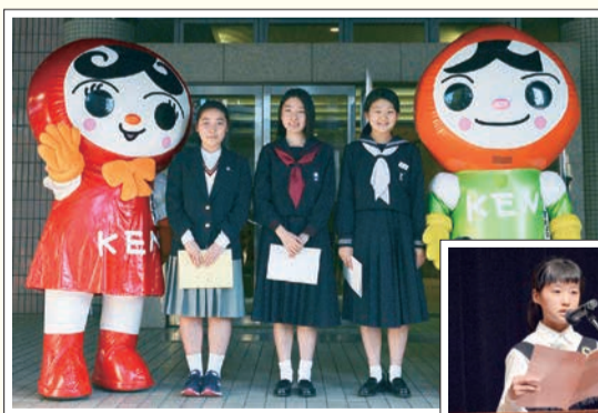
区内児童・生徒による人権メッセージや人権作文の朗読

義足の体験コーナーや区内児童・生徒による人権標語の展示、犯罪被害者の声のパネル展示