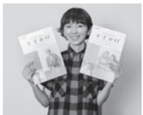
巻頭インタビューは 渡辺 満里奈氏