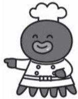
墨田区食品衛生キャラクター「すみだこ」

区では、夏場における食中毒発生防止と食の安全確保を図るため、毎年6月～8月に食品衛生夏期対策事業を行っています。この事業では、食品の製造・販売施設等を対象として立入検査を実施しますので、ご協力をお願いします。