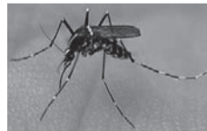
▲ヒトスジシマカ(成虫)