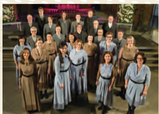
ラトヴィア放送合唱団

【とき】10月22日(土)午後3時開演【出演】ラトヴィア放送合唱団、シグヴァルズ・クラヴァ(指揮)、新日本フィル【曲目】J.S.バハ「イエス、わが喜び」、ヴァスクス「私たちの母の名」、モーツァルト「レクイエム 二短調 K.626」ほか【入場料(全席指定)】▶S席=6000円 ▶A席=5000円 *区内在住在勤の方は3500円 *区内在住在学の小・中学生、高校生、大学生等は1000円