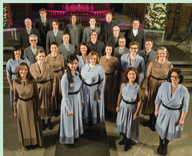
ラトヴィア放送合唱団

【とき】10月22日(土)午後3時開演【出演】ラトヴィア放送合唱団、シグヴァルズ・クラヴァ(指揮)、新日本フィルハーモニー交響楽団【曲目】J.S.バッハ「イエス、わが喜び」、モーツァルト「レクイエム」ほか【入場料(全席指定)】▶ S席=6000円 ▶ A席=5000円 * 区内在住在勤の方は3500円、区内在住在学の小学生~高校生、大学生等は1000円