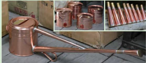
280度で溶かしたはんだで素早く部品をつなぎます。とても暑い中での作業です。