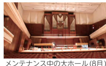
メンテナンス中の大ホール(8月) [練習室]3室

[住所]錦糸1-2-3[大ホール]1801席(取材時の8月は照明のケーブルリールやワイヤレス機材の工事を行っていました。公演は、秋から冬にかけて多いため、ホールが空く8月にメン