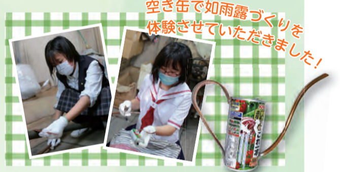
空き缶で如雨露づくりを体験させていただきました!

「お客様一人ひとりのこだわりを大切にしたい。」そんな思いから、1点ごとに要望を聞きながら何度も修正を重ねるそうです。その姿が、長年愛される理由ではないでしょうか。