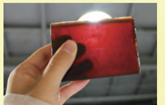
できたての石けん。まだ柔らかかったです。

「ものづくりは人づくり」という言葉があるように、人に喜ばれる製品は誠実な人によって作られます。という話が印象的でした。松山油脂では入社時に、「挨拶」「整理整頓」「人の話を聞く態度」という3つの大切なことを教わるそうです。私たちが工場内を見学した際も、皆さんとても忙しそうでしたが、笑顔で挨拶をしてくださり、とても嬉しかったです。心のこもった製品に、私たち消費者も幸せな気分になりますね。