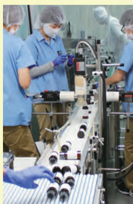
奥ではラベリング、手前では箱に詰める作業を行っています。

工場では「ラインの切り替え」という数時間に1度の大きな作業があります。1つの部屋で別の製品を作るために、機械の部品を入れ替えることをそう呼びます。これにより、松山油脂では、少量多品種のものづくりを実現しています。同じものを使っても、肌に合う人と合わない人がいます。それぞれの肌に合うような製品を提供する方法の1つが少量多品種のものづくりです。