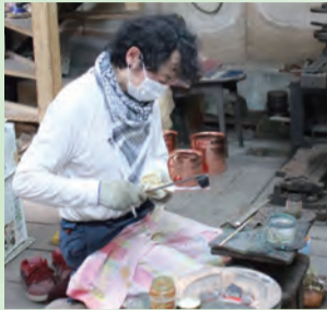
大きい如雨露は1日で4個ほどしか作れないそう。

根岸産業は1944年創業。神社などの修理を行っていた根岸社長のおじいさんが、空襲で「がれき」となった町からトタンなどの廃材を集め、バケツをはじめとした生活用品を作ることから始まったそうです。