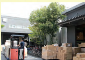
工場の敷地には各地に運ばれる製品が。木の裏には、原料の油が入った大きなタンクがあります。

松山油脂をはじめ、昔は区内に石けんの製造会社がたくさんありました。なぜなら、すみだでは革製品づくりが盛んで、その材料の皮からは、石けんの原料となる油が採れたためです。また、すみだは河川による物資の運搬もしやすかったため、多くの会社が集まりました。