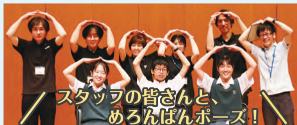
スタッフの皆さんと、めろんぱんポーズ!

日頃からインターネットなどで手軽に音楽を聞くことができるうえ、新型コロナウイルス感染症の影響もあり、直接演奏を聴く機会は減っているかと思えます。でも皆さん、今年、すみだトリフォニーホールは開館25周年、同ホールを活動の本拠地とする新日本フィルハーモニー交響楽団は創立50周年という節目の年を迎えます!新日本フィルハーモニー交響楽団50周年の記念公演なども行われます。すみだにある素晴らしいホールで、生の演奏を、ぜひ、聴いてください。