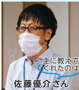
主に教えてくれたのは