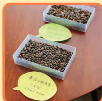
▲ 手前が鹿沼市の在来種で、粒が小さいのが特徴

鹿沼市で採れるそばは江戸時代からの在来種であり、品種改良は一切行っていません。そばの実表皮がたんぱく質で中心はでんぷん質ですが、鹿沼在来のそばは一般的なそばの実と比べて表皮が薄分、でんぷん質が豊富なため、雑味のないほのかな甘みもち、シャッキリとした歯ごたえのそばになるのが特徴です。そばは受粉の際に近隣の他品種と交雑が起きてしまうのが一般的です。しかし鹿沼市は、日光連山の南麓に位置し、栽培環境が沢に囲まれた閉鎖環境のため交雑が起きず、加えて昼夜の寒暖差が激しいという栽培に適した条件がそろっているため、おいしいそばができます。まさに、自然が育んだ伝統の味です。また、10月下旬頃〜11月頃のまさに今しか味わえないのが「新そば」です。実の表皮が、酸化前の緑色をした新鮮な状態のものを挽くため、さわやかに特に香ばしいものになります。この新そばが提供できるのは、一番おいしいときに収穫ができていく証拠です。保存分のそばの実は、収穫後、マイナス2度で60日以上熟成させ、甘みを引き出します。この低温保存によって味の深みが増したのも絶品です。さらに、1月の最も寒い時期には殻付きのそばの実を冷水に漬けて寒風にさらす「寒晒そば」があり、こちらは余分なアクが抜け、より熟成されて一層甘みと風味が増します。鹿沼市では年間を通して、異なる表情の絶品そばが楽しめます。