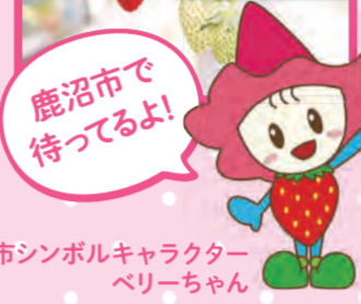
鹿沼市シンボルキャラクター ベリーちゃん

都内にお住まいでも、スーパーなどでおいしい栃木県産のいちごは手に入りますが、現地のいちご狩りで食べられるいちごは完熟した一番甘い状態のものなので、より一層おいしいです。ぜひ鹿沼市に来て、いちごを食べてくださいね。また、鹿沼市には「いちごを育てる技術」があるため、おいしいいちごを手頃な価格で食べることができるんですよ。私たちが丹精を込めて育てたいちごのハウスに入ると、甘い香りが広がっており、鈴なりに実った赤い果実はどれもみずみずしく大粒です。ぜひとも、品質にこだわり抜いた鹿沼市のいちごを味わっていただきたいです!