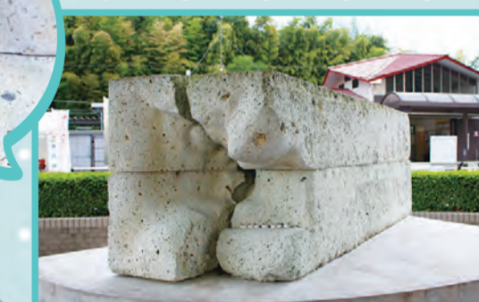
▲ JR鹿沼駅前に設置されている「シウマイ像」

かぬまシウマイに関する詳細や、市内のシウマイ観光ガイドブックについては、鹿沼シウマイ公式ツイッターをご覧ください。