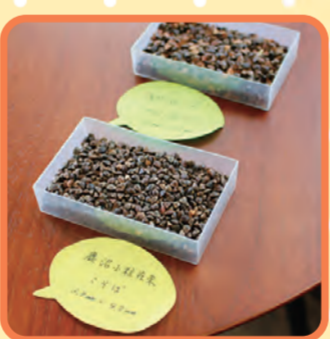
▲ 手前が鹿沼市の在来種で、粒が小さいのが特徴

鹿沼市で採れるそばは江戸時代からの在来種であり、品種改良は一切行っていません。そばの実表皮がたんぱく質で中心はでんぷん質ですが、鹿沼在来のそばは一般的なそばの実と比べて表皮が薄分、でんぷん質が豊富なため、雑味のないほのかな甘みもち、シャッキリとした歯ごたえのそばになるのが特徴です。そばは受粉の際に近隣の他品種と交雑が起きてしまうのが一般的です。しかし鹿沼市は、日光連山の南麓に位置し、栽培環境が沢に囲まれた閉鎖環境のため交雑が起きず、加えて昼夜の寒暖差が激しいという栽培に適した条件がそろっているため、おいしいそばができます。まさに、自然が育んだ伝統の味です。 また、10月下旬頃〜11月頃のまさに今しか味わえないのが「新そば」です。実の表皮が、酸化前の緑色をした新鮮な状態のものを挽くため、さわやかに特に香ばしいものになります。この新そばが提供できるのは、一番おいしいときに収穫ができていく証拠です。保存分のそばの実は、収穫後、マイナス2度で60日以上熟成させ、甘みを引き出します。この低温保存によって味の深みが増したのも絶品です。さらに、1月の最も寒い時期には殻付きのそばの実を冷水に漬けて寒風にさらす「寒晒しそば」があり、こちらは余分なアクが抜け、より熟成されて一層甘みと風味が増します。鹿沼市では年間を通して、異なる表情の絶品そばが楽しめます。