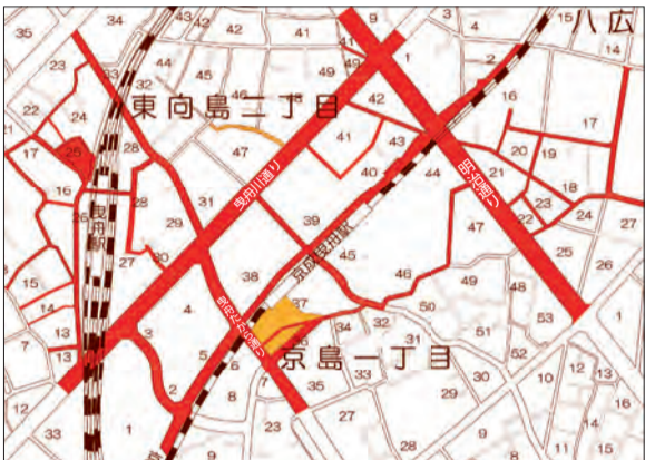
現在の自転車放置禁止区域 (赤線) 新たに指定する自転車放置禁止区域 (黄線)