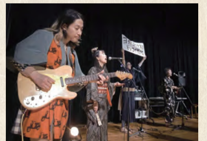
昨年実施したプロジェクト企画「盆踊りストリープ」