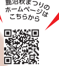
鹿沼秋まつりのホームページはこちら