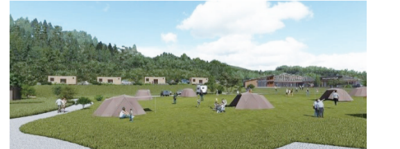
キャンプ場(イメージ図) *運営は、アウトドアメーカーの株式会社スノーピーク