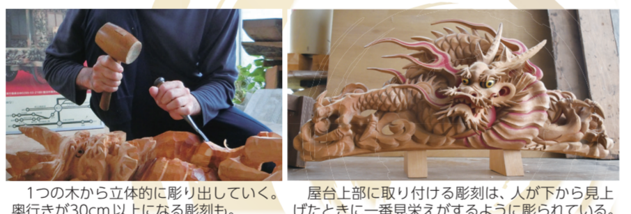
1つの木から立体的に彫り出していく。奥行きが30cm以上になる彫刻も。屋台上部に取り付ける彫刻は、人が下から見上げたときに一番見栄えがするように彫られている。

彫刻のデザインは各町で同じものではなく、例えば同じ龍でも町ごとに構図が異なります。また、その町ならではのものが取り入れられることもあります。例えば、私が携わった上野町の屋台上部には、運送業が盛んで荷馬車が往来していた土地柄にちなみ、蹄の付いた「龍馬(りゅうま)」を取り入れています。そのほかにも町ごとに様々な動物や植物、霊獣などの彫刻が飾り付けられていますので、ぜひ、各町自慢の屋台をご覧ください。