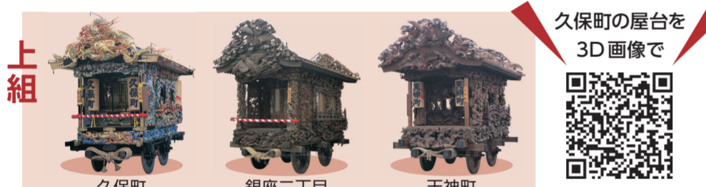
久保町の屋台を3D画像で