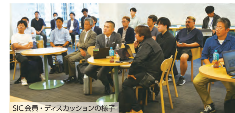
SIC会員・ディスカッションの様子