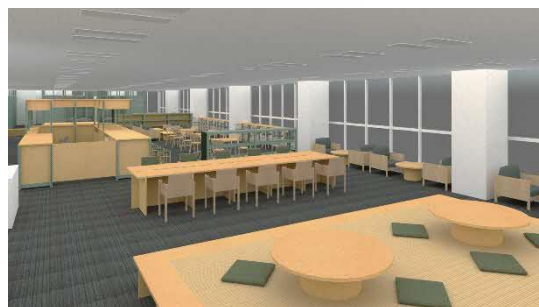
施設空間・製作家具のイメージ