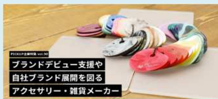
PICK UP 企業 Vol.90 ブランドデビュー支援や 自社ブランド展開を図る アクセサリ・雑貨メーカー