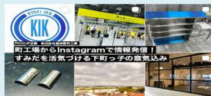
PICK UP 企業 Vol.91 町工場からInstagramで情報発信！ すみだを活気づける下町っ子の意気込み