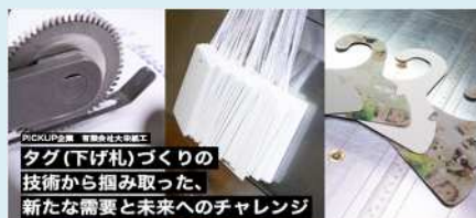
PICK UP 企業 Vol.91 タグ(下げ札)づくりの 技術から掘り取った、 新たな需要と未来へのチャレンジ