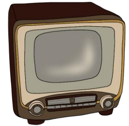
▲ 昔のカラーテレビ