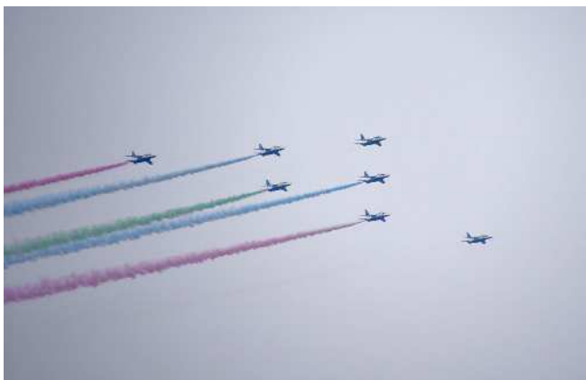
2021年8月24日投稿「#ブルーインパルス #ありがとう」