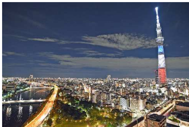
2021年8月8日投稿「See you in #Paris」