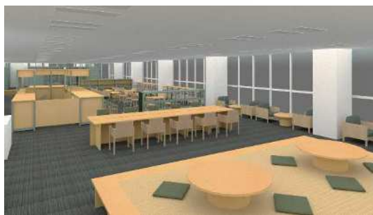
施設空間・製作家具のイメージ