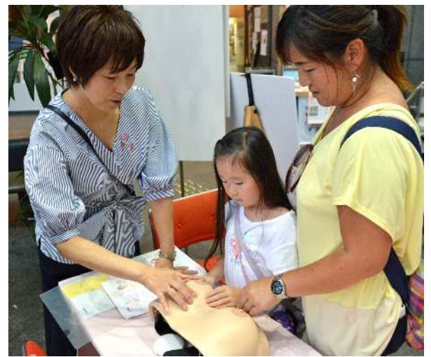
イベントの様子（乳房チェック）

「がん対策アクション&ピンクリボン in すみだ」開催概要（詳細は別添資料を参照）