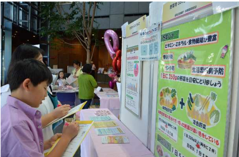
イベントの様子（がんに関わるクイズラリー）

会場には、がん発症の原因、在宅緩和ケアなどについてわかりやすく解説したパネルを展示している。がんになっても自分らしく暮らし続けるために、専門家にがんの療養や訪問指導等について相談できるコーナーも設置（2日から）。また、医師や、がん患者をサポートするNPO法人等が講演会も開催する（3日から）。さらに、オリナス1階（太平四丁目1番2号）では、乳がんの自己触診レクチャーやがんに関わるクイズラリーやグッズの配布を行う「ピンクリボンイベント in オリナス」を開催する。その他、都立墨東病院（江東橋四丁目2番15号）でがんと暮らしに関する展示を行う（6日～12日）ほか、緩和ケア認定看護師等によるスキンケアやマッサージの講習会、緩和ケアに関する展示・講演会を行う「オレンジバレーンプロジェクト in 墨東」も開催する（10月6日～12日）。