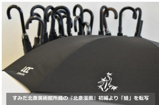
すみだ北斎美術館所蔵の『北斎漫画』初編より『蛙』を転写