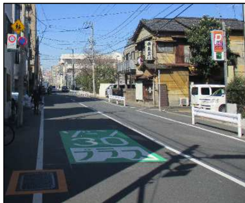
区域内写真（整備後）

区域内の規制開始に当たり、次の日時・場所で、警視庁及び墨田区が交通安全の啓発キャンペーンを実施します。