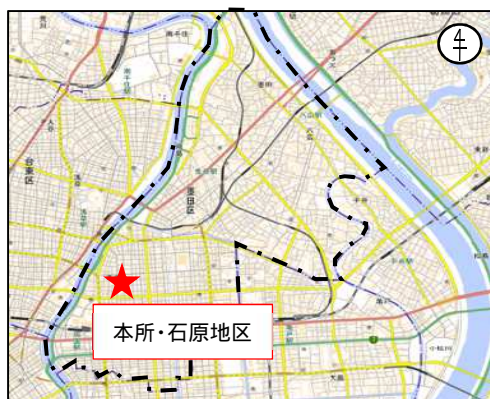
国土地理院の地理院地図に設定箇所等を追記して掲載