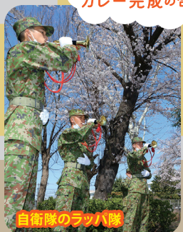
ラッパの演奏がカレー完成の合図！