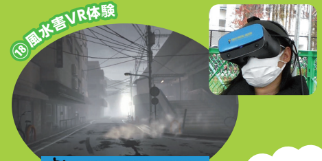
風水害VR体験 TOKYO VIRTUAL HAZARD