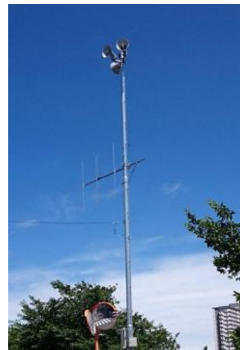
写真 固定系防災行政無線（子局）