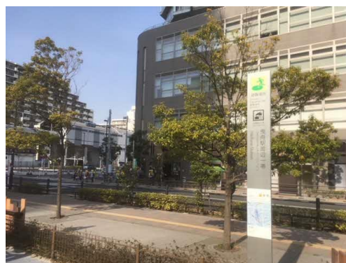
写真 避難場所標識 (曳舟駅周辺一帯)