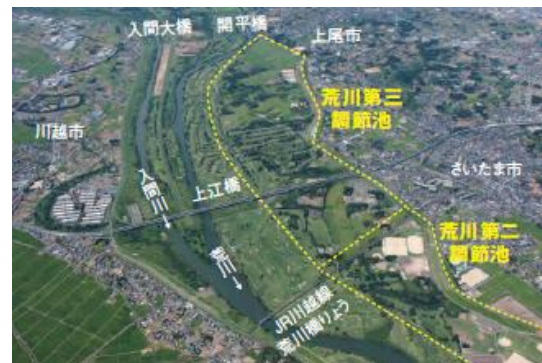
出典 「なるほど!! 荒川第二・三調節池」 国土交通省関東地方整備局荒川調節池工事事務所