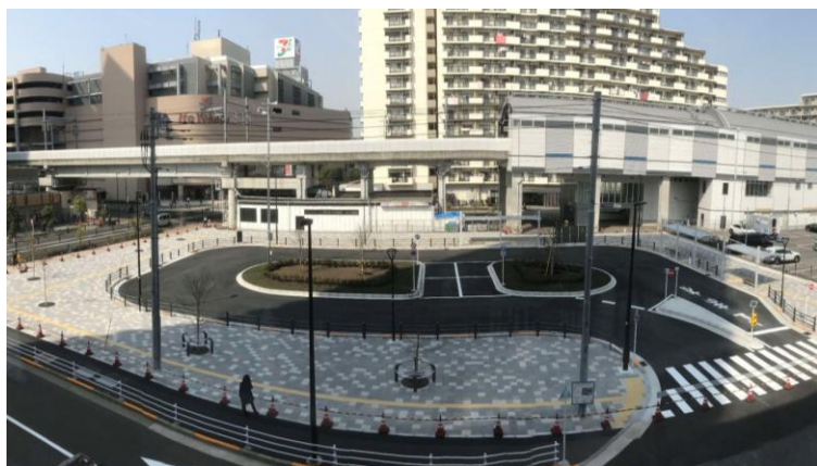
写真 京成曳舟駅交通広場