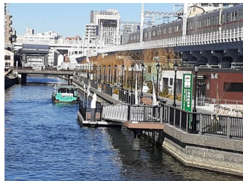
写真 小梅橋防災船着場