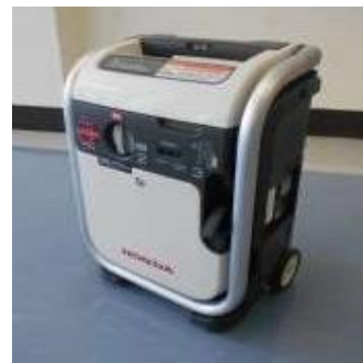
写真 避難所に設置する発電機