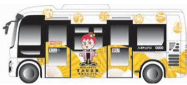
電気バス「すみりんちゃん」

北西部ルートと北東部ルートで共用していた③ 飛木稲荷神社入口④ トラバシ児童遊園は、北東部ルートのための停留所となります。