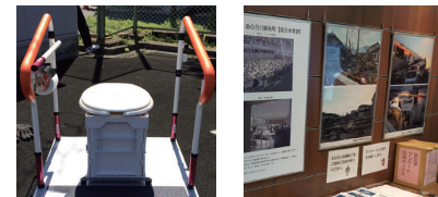
防災資機材の展示も 震災のパネル展示