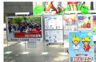
区役所での防災展の様子