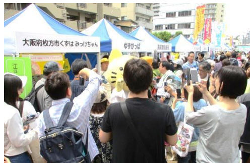
▲大横川親水公園PRブース出展（画像はイメージです）