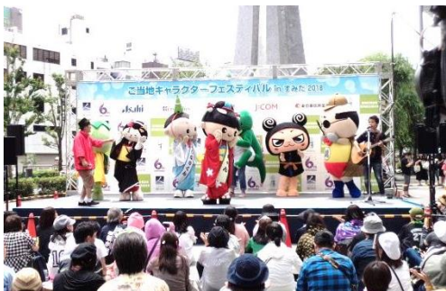
▲東京スカイツリータウン1Fソラマチひろばステージ（画像はイメージです）