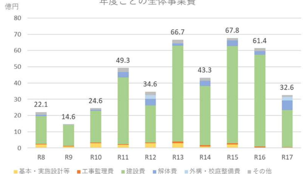
年度ごとの全体事業費

物価高騰、労務単価の上昇、技術者不足、 工事手法に高い技術が必要となる場合、 グレードアップが必要な内容が生じた場合等