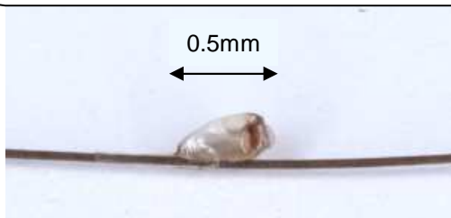
髪の毛に産み付けられたアタマジラミの卵

アタマジラミが頭部を吸血すると、かゆみを引き起こします。特に耳の後ろ、後頭部を掻いていたら要注意です。