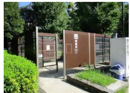
隅田公園喫煙所（向島1丁目）