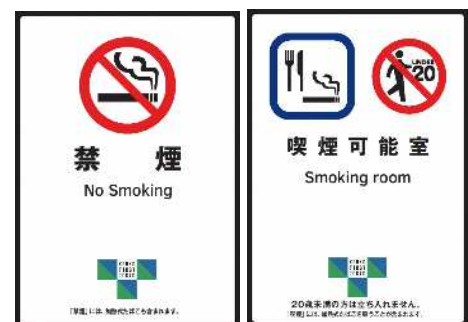
標識（ステッカー）の例

特に飲食店については、営業形態により掲示する標識が多岐にわたり、複雑となっているため、区では、飲食店への受動喫煙対策の普及啓発として、喫煙状況についての店頭表示調査と啓発を実施しました。調査の際に標識を掲示していない店舗に対しては、掲示をするよう啓発を行うとともに、区が作成した標識を配布しました。