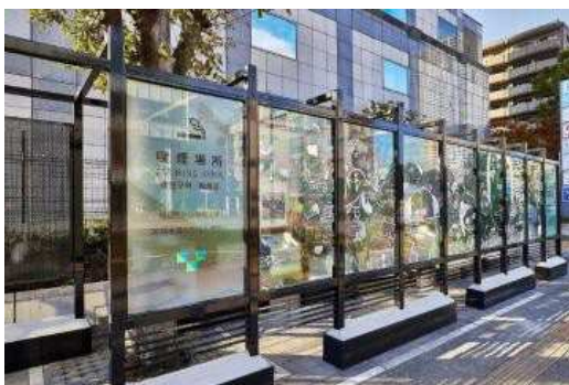
錦糸町駅北口喫煙所（錦糸3-2）