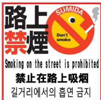
路上ブロック・路面シート表示

路上喫煙禁止推進地区内では、区が委託する啓発指導員により、錦糸町駅周辺を週6日、両国駅周辺を週2日、押上駅周辺を週1日、曳舟駅周辺を週4日及び吾妻橋地区周辺を週1日、通行者の多い時間帯に啓発及び指導パトロールを行い、その際に路上喫煙、歩きたばこ、ポイ捨てについて発見した場合には、喫煙者に対する指導や吸い殻等の収集・清掃を行っています。また、路上喫煙禁止推進地区等において、年間で複数回、吸い殻数の測定を実施しているほか、推進地区内に、路上喫煙禁止のブロック・ペイントや看板の設置等を実施しています。他にも、毎年春と冬の年2回、職員クリーンアップキャンペーンとして、錦糸町駅周辺エリア、東京スカイツリー周辺エリア、曳舟駅周辺エリア、両国駅周辺エリア等で、協力企業、団体等の方々と職員が吸い殻などのごみを收拾しつつ、あわせて路上喫煙禁止の啓発を行っています。