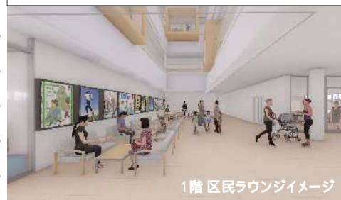
1階 区民ラウンジイメージ