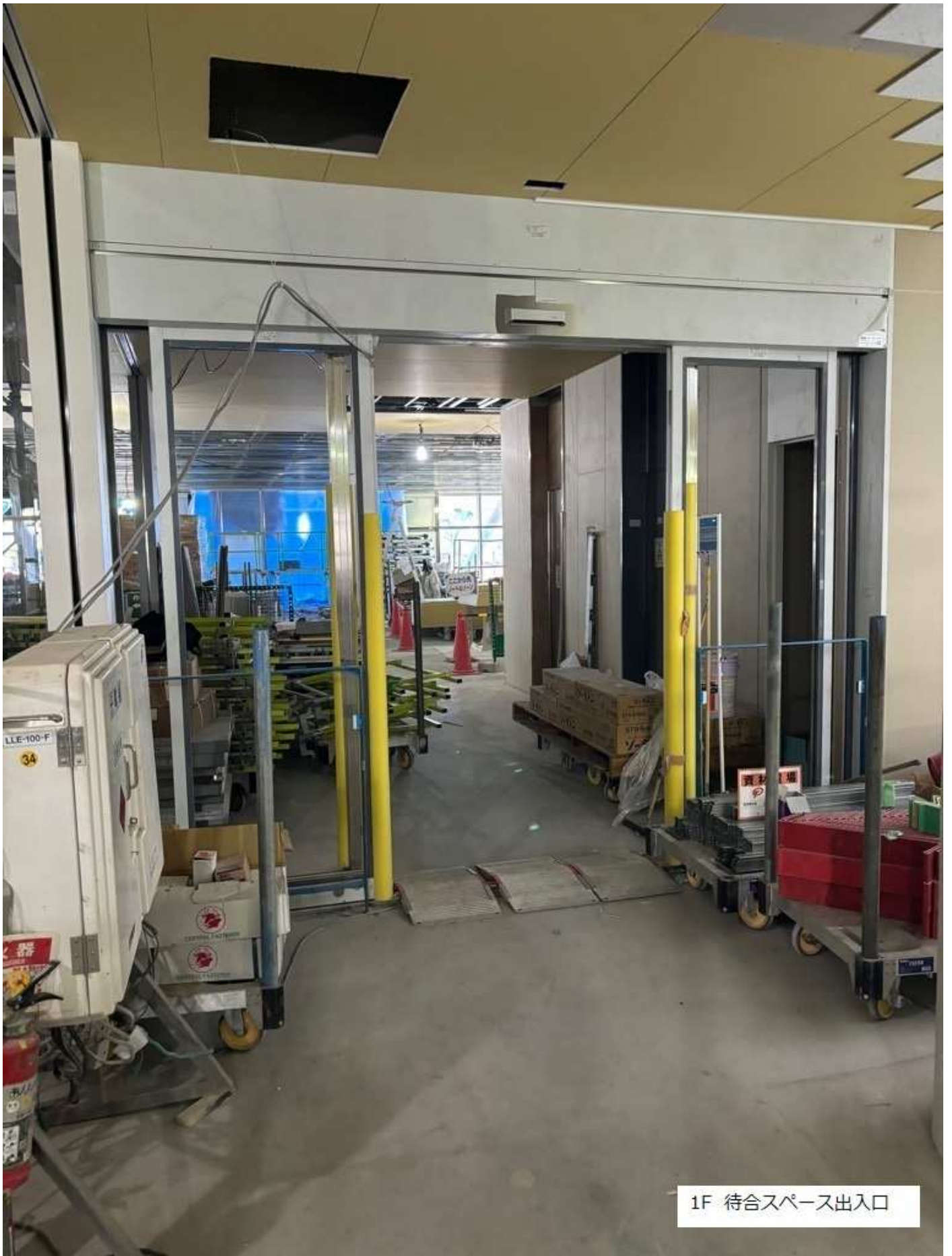
1F 待合スペース出入口