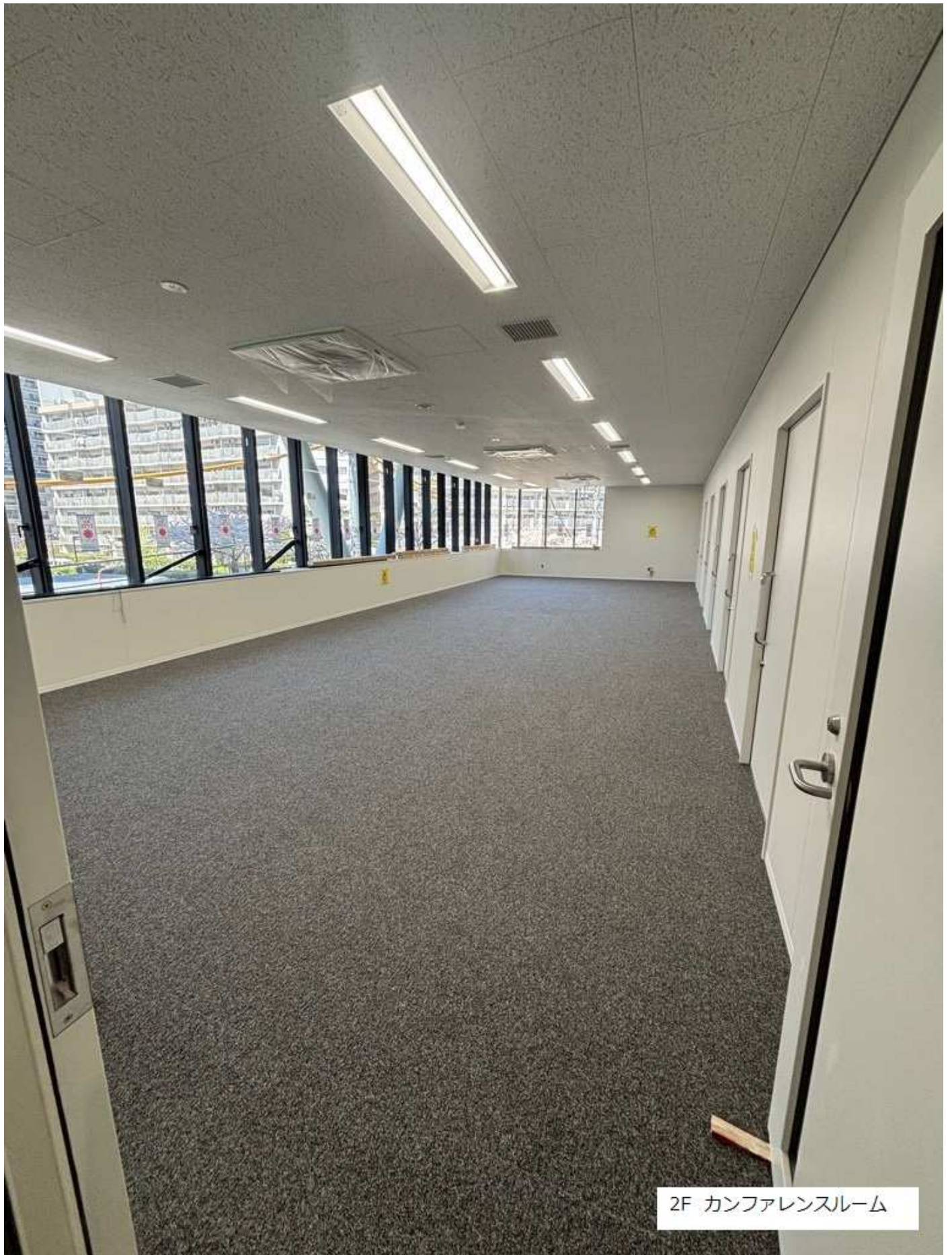
2F カンファレンスルーム