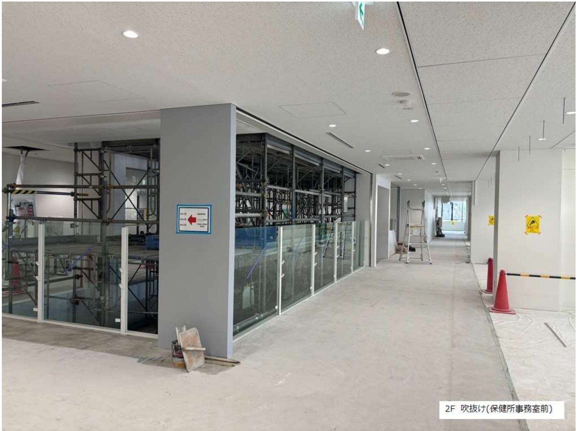
2F 吹抜け(保健所事務室前)