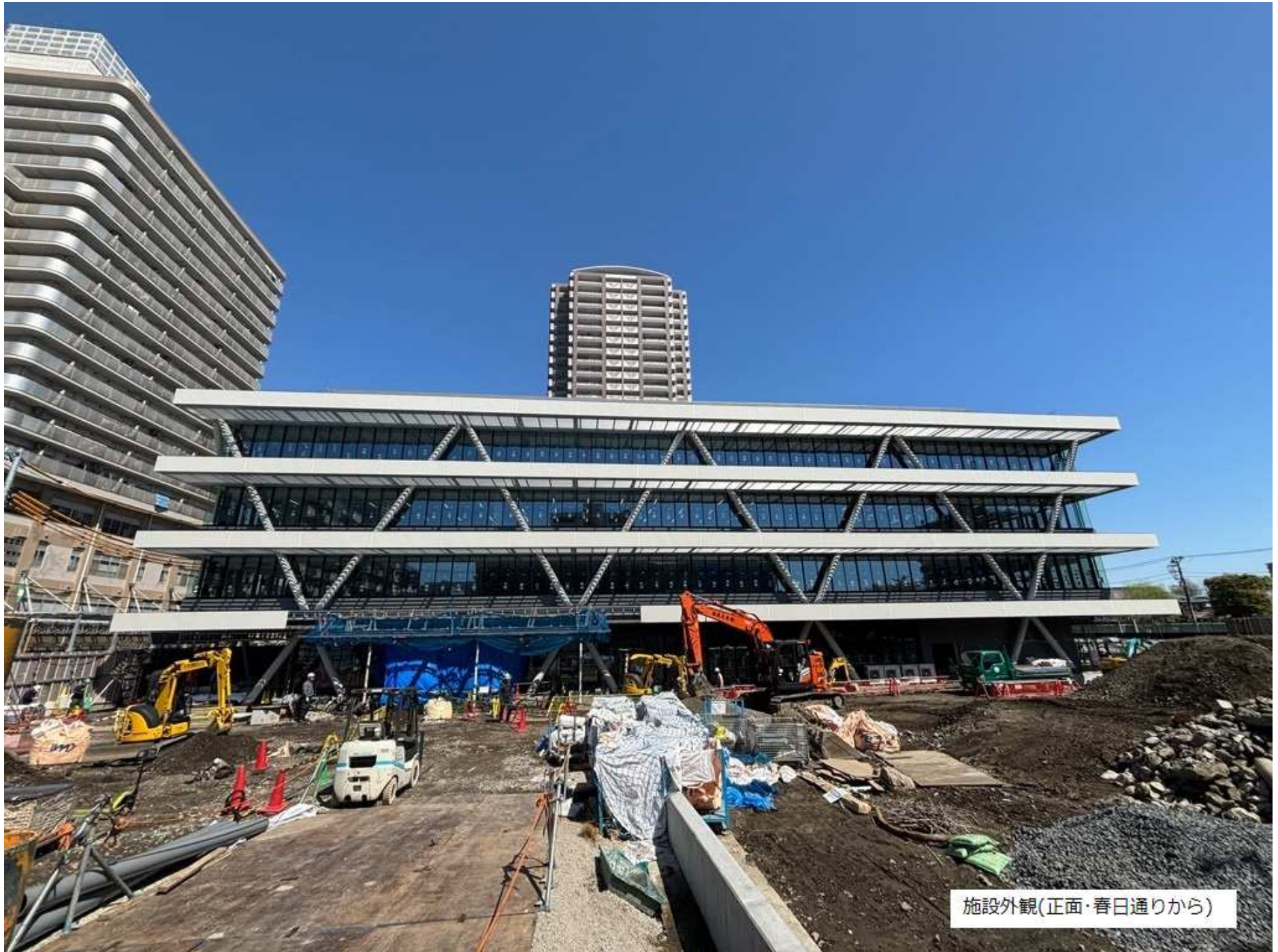
施設外観(正面・春日通りから)