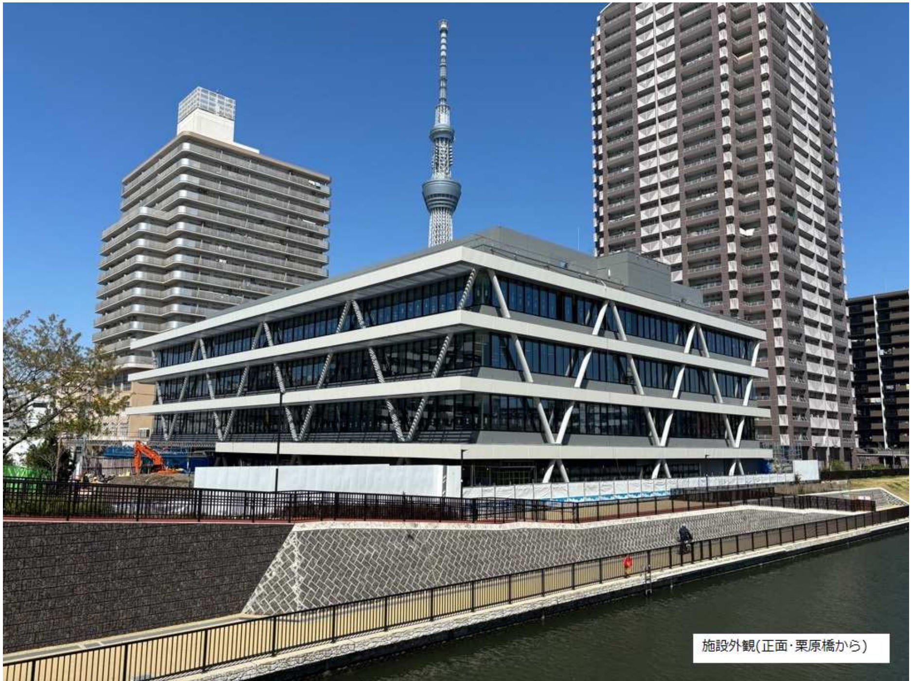
施設外観(正面・栗原橋から)