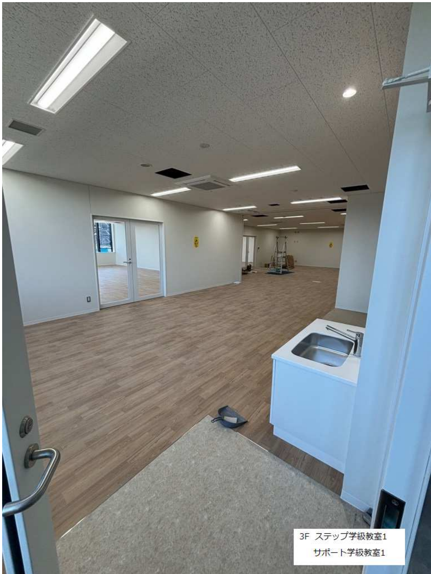
3F ステップ学級教室1 サポート学級教室1