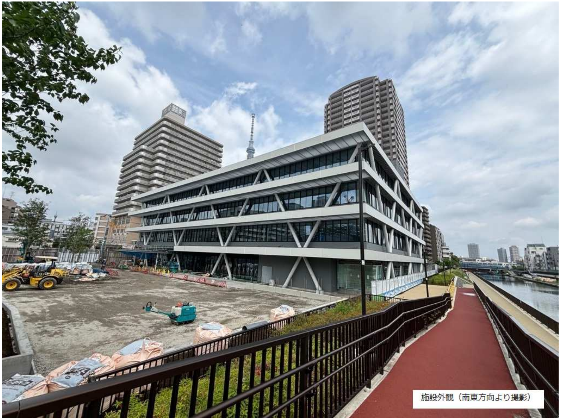
施設外観（南東方向より撮影）