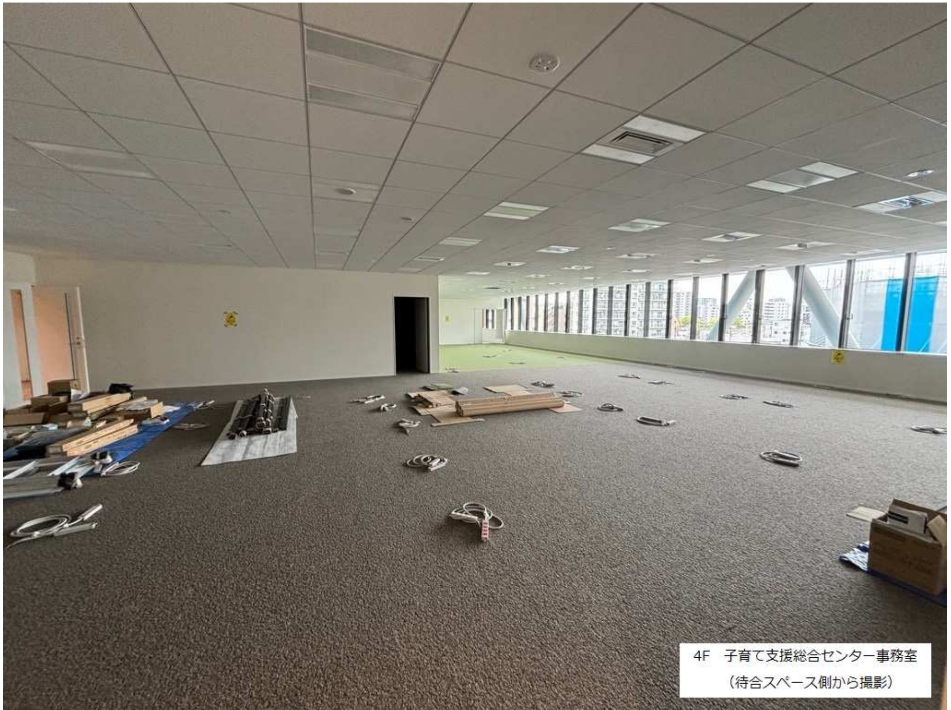
4F 子育て支援総合センター事務室 (待合スペース側から撮影)