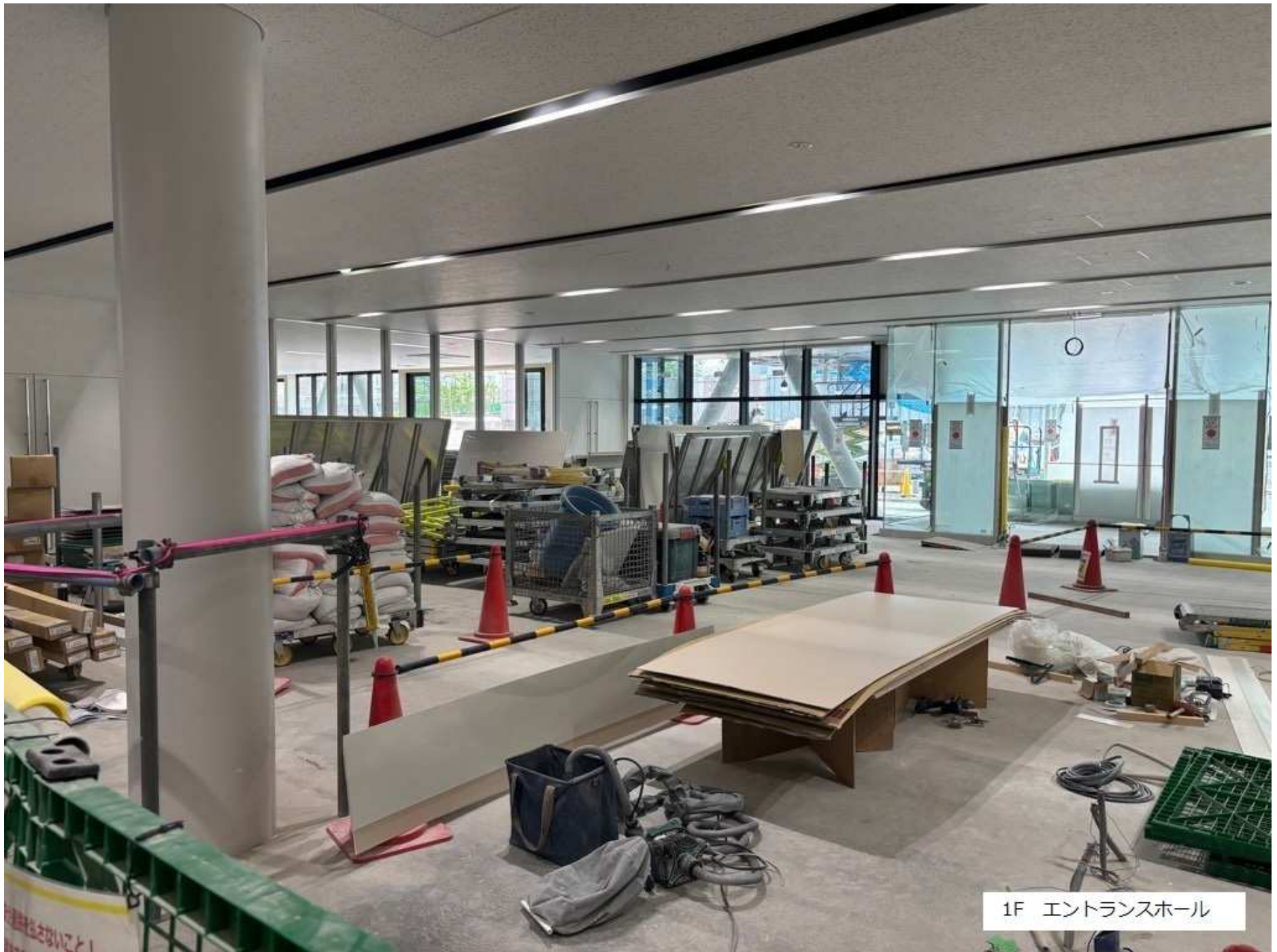
1F エントランスホール