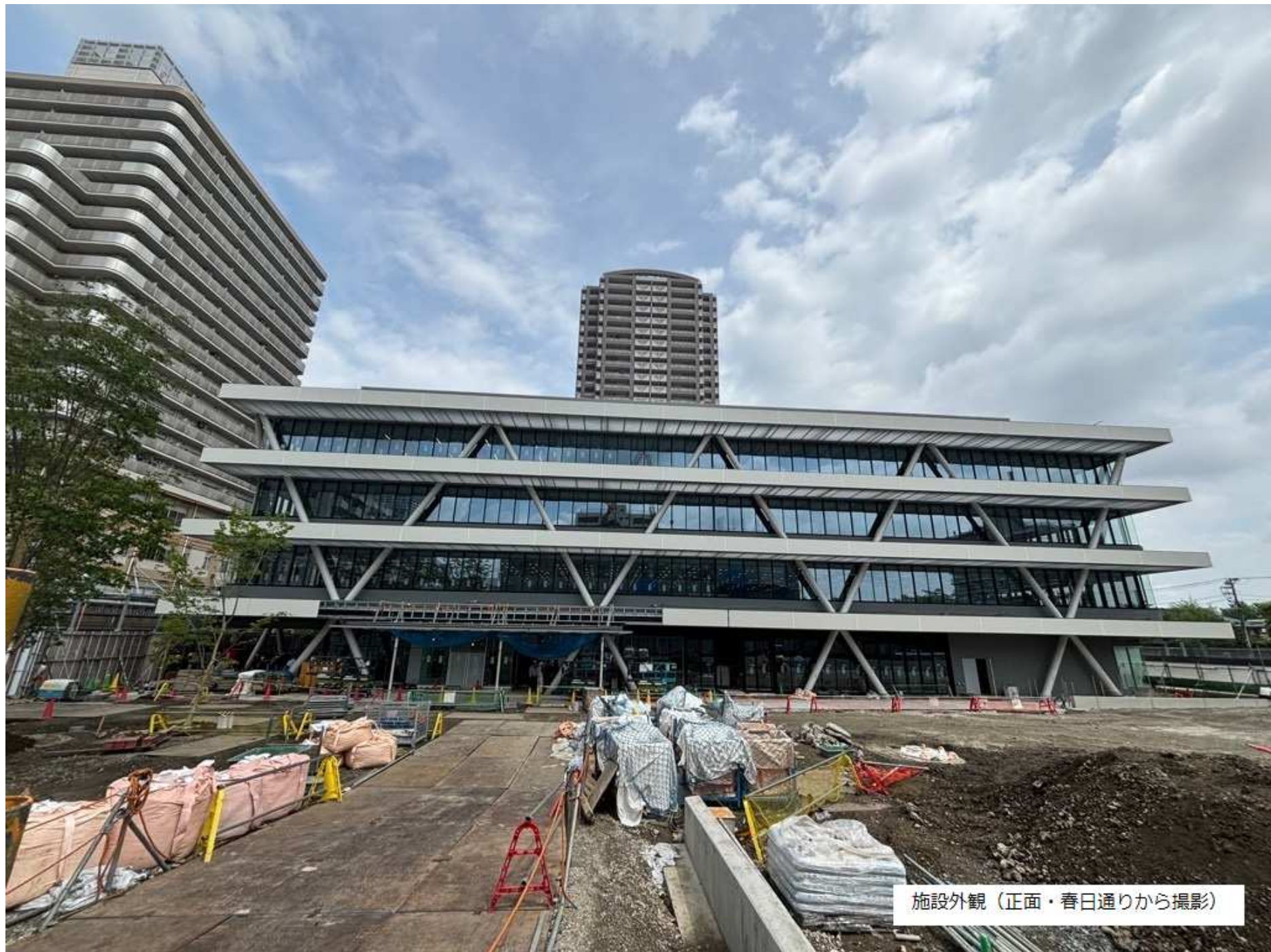
施設外観（正面・春日通りから撮影）