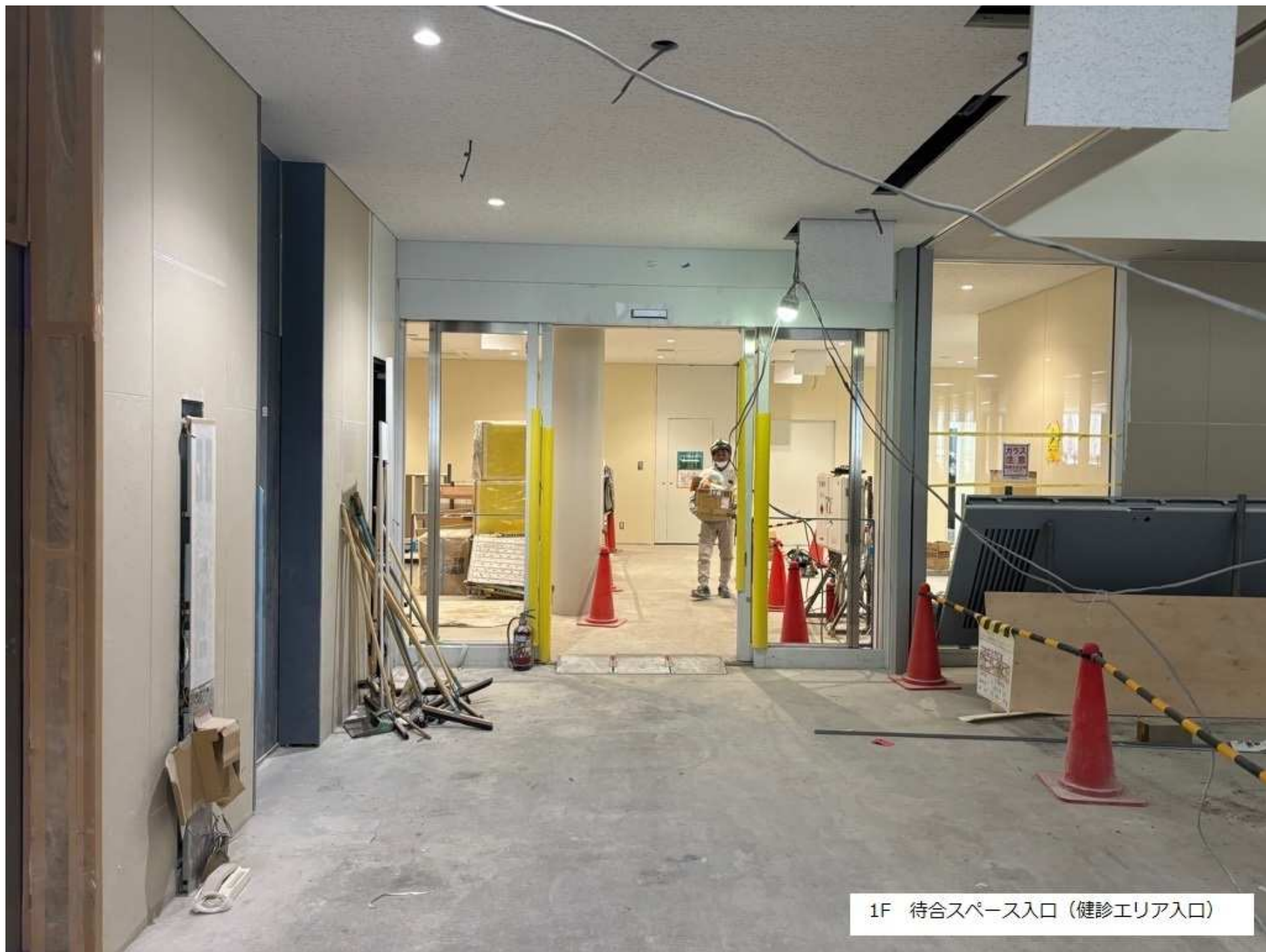
1F 待合スペース入口（健診エリア入口）