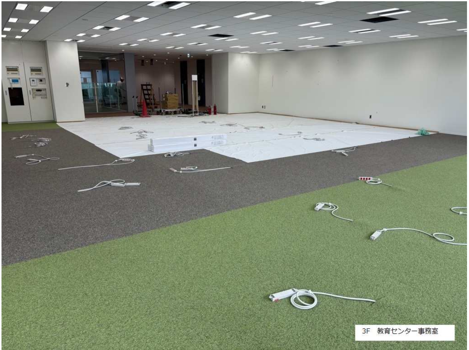
3F 教育センター事務室