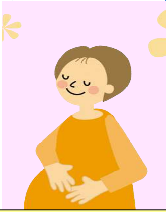
風しん抗体価基準（区事業）