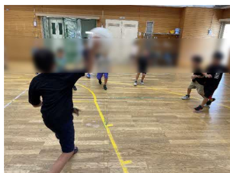
【スポーツルーム遊び】