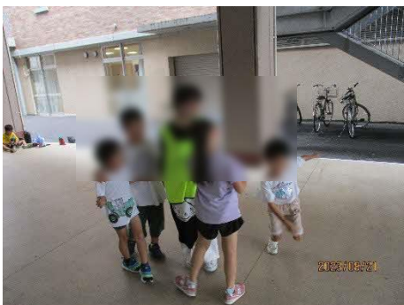
中学校のピロティ