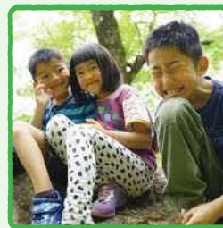
自然体験・野外活動