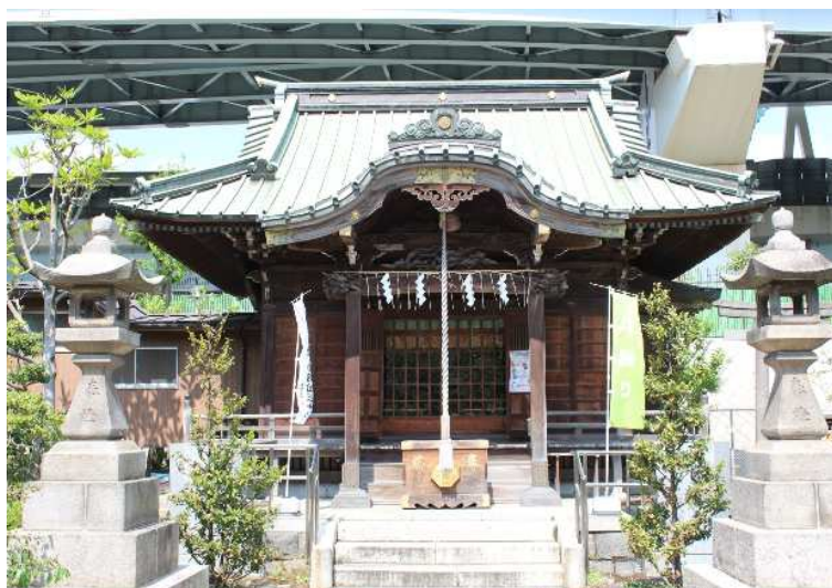
「隅田川神社社殿」前景

以上のことから、墨田区内においては希少価値の高い当文化財をさらに墨田区の指定文化財とし、所有者に対してより積極的に保存のための措置を講じるよう促すこととしたい。このため、墨田区文化財保護審議会に当文化財を指定文化財とすることについて意見を求める。