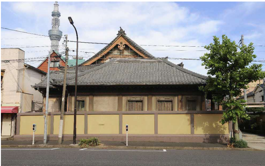
西面 西側路上から