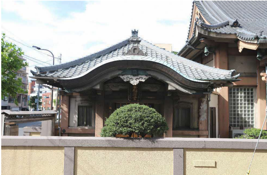
正面 南側路上から