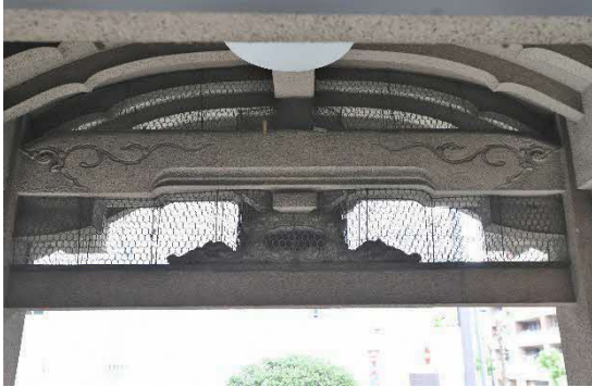
向拝 水引虹梁・曇股