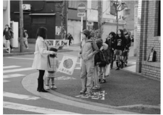
二葉小学校学校安全ボランティアの活動の様子