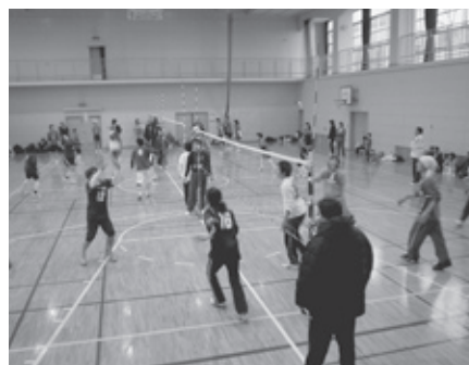
スポーツドアあずままでの活動風景 (ソフトバレーボール)