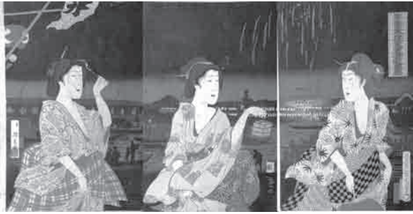
両国花火夕涼之景

【とぎ】5月23日（土）～9月13日（日） 午前9時～午後5時 *入館は午後4時30分まで *毎週月曜日（祝日）の