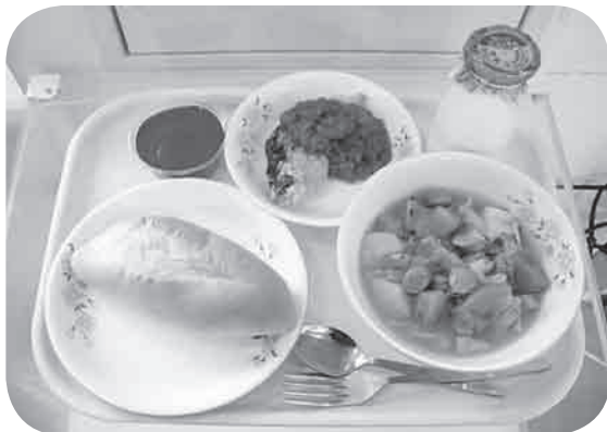
写真はフランスの料理です。献立はソフトフランスパン、ポトフ、メルルーサ・プロヴァンス風、ワインゼリー、牛乳です。