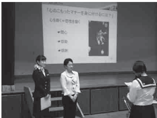
外部講師によるマナー講習会の様子（本所中学校）

民・企業・学生等）が教員をサポートし、学校を支える活動を行っており、教育の質の向上が図られてきています。