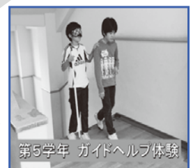
第5学年 ガイドヘルプ体験

本校は、子どもたちのボランティアマインドを醸成するのみならず、自尊感情を高めるとともに、共生社会の実現に向け、思いやりの心を育てていくことを目指しております。各学年の実態に応じて、体験的な学習に取り組んでいます。第5学年のガイドヘルプ体験後、「町で困っている人がいたら声を掛けていきたいです。」と感想としてまとめていました。