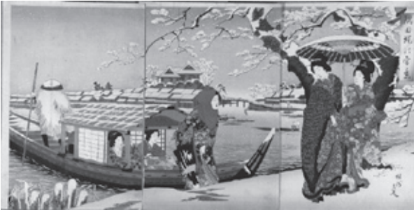
周延画「隅田堤の雪景」明治24年（1891）

島2〜3〜5）「入館料 個人1100円 団体（20人以上）80円 *中学生以下と身体障害者・愛の手帳をお持ちの方は無料