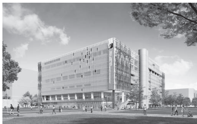
（総合体育館 完成予想図）