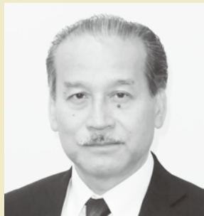
教育長職務代理者