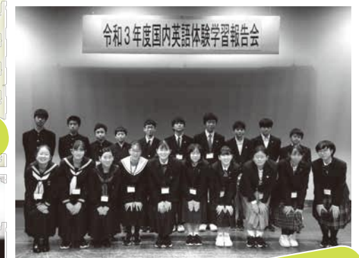
国内英語体験学習報告会