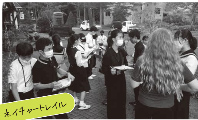
ネイチャートレイル