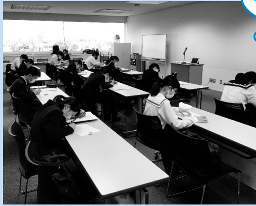
オリエンテーション の様子